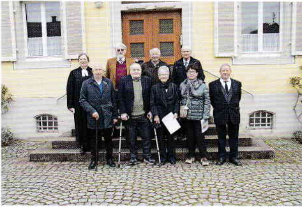
Jahrgang 1957 - Eherne Jubilare