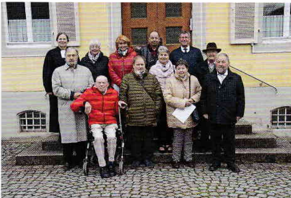
Jahrgang 1962 - Diamantene Jubilare

Der Kirchenchor sang einen irischen Segen. Hier ein weiterer handfester Segen::