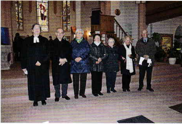
Jahrgang 1952 - Gnaden-Jubilare