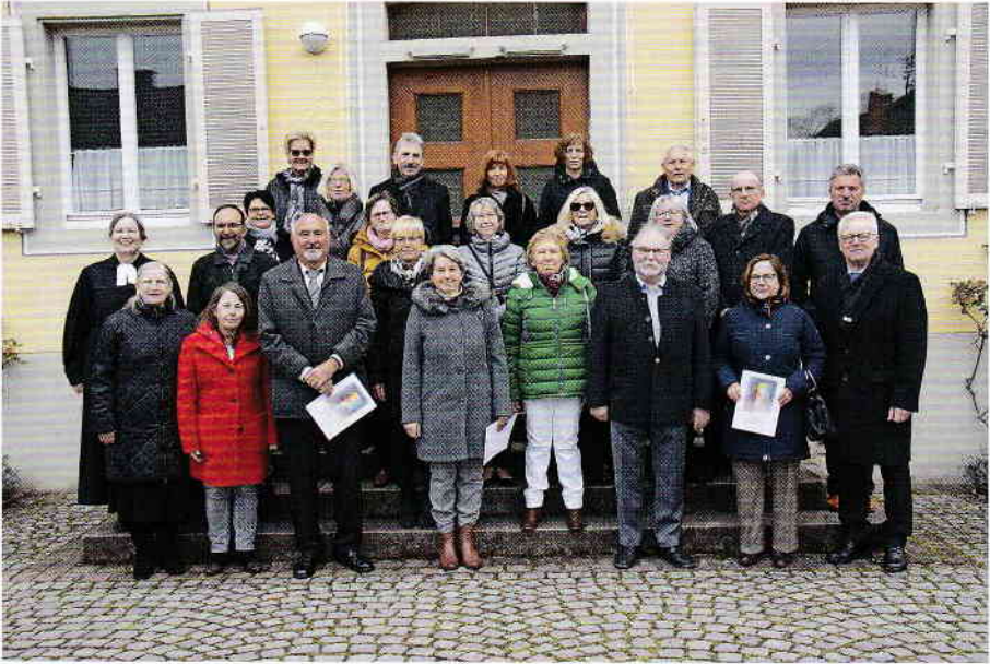
Jahrgang 1972 - Goldene Jubilare