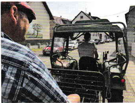
Der Kirchengemeinderat auf dem Weg zur Sitzung auf der Schelinger Matte

Da das auswärtige Übernachten für dieses Jahr einfach nicht planbar war, haben wir preiswert zu Hause geschlafen und sowohl in unserem tollen Pfarrgarten als auch in der Außengastronomie in Vogtsburg und in Oberried getagt. Zu Beginn des gemeinsamen Wochenendes fuhren wir am Freitagabend auf die Schelinger Matte. Unter Schatten