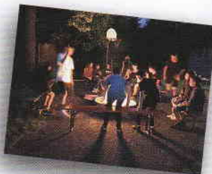
Lagerfeuer mit Stockbrot im Pfarrgarten