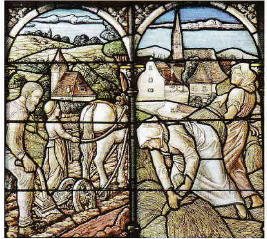
Im rechten unteren Buntglasfenster

Darunter ist zu lesen: „Zur Ehre der im Weltkrieg 1914/18 gefallenen