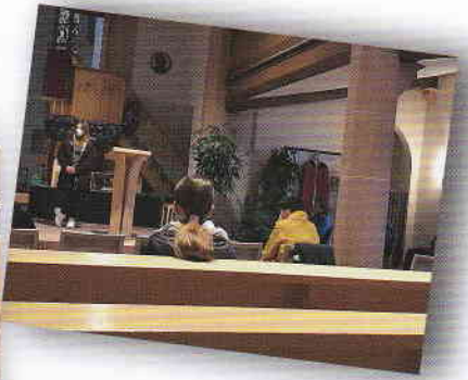
Viele Gottesdienste - immer mit Abstand und ganz vorne dabei

Die Kirche war 'unser' Raum - vom Arbeiten mit Abstand über Tandem-Gottesdienste bis zur Kirchenübernachtung auf den Emporen