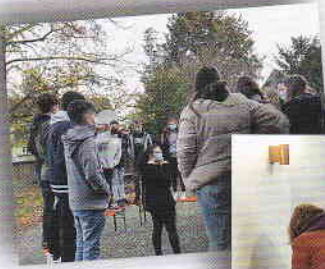
Kennenlern- und Kontaktspiele