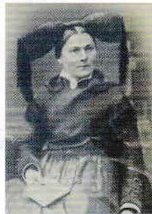
Dorfgraben 13