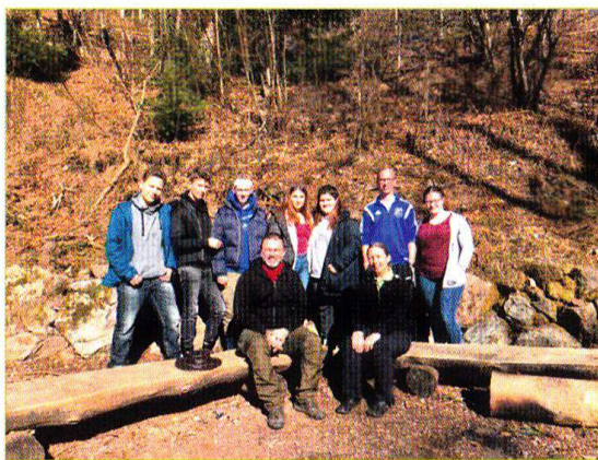
Die Teamer aus den beiden Kirchengemeinden