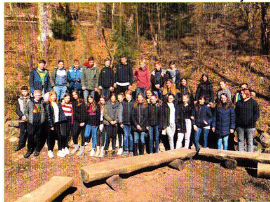
Die diesjährigen Konfirmanden aus Vörstetten und Eichstetten

Ein bisschen trauern wir ja schon dem Haldenhof nach, der, im Simonswälder Tal hinter Wildgutach gelegen, lange Jahre vom Evangelischen Kirchenbezirk Emmendingen betrieben wurde und wo wir in dieser Zeit unsere Konfirmanden-Freizeiten abgehalten haben. Inzwischen haben wir zwei weitere schöne und schön gelegene Häuser im Simonswälder Tal kennengelernt: den Wolfshof und den Ibichhof. Zum zweiten Mal waren wir Ende Februar mit den Konfirmanden aus Eichstetten und aus Vörstetten, mit Teamern aus beiden Dörfern und mit zwei Vörstetter Kirchengemeinderäten als Küchenteam zur Konfirmanden-Freizeit auf dem Ibichhof. Dabei finden wir es immer wieder spannend, wie sehr die Gemeinschaft die jun-