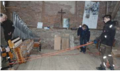
Von oben wird mit Seilen gegengehalten.