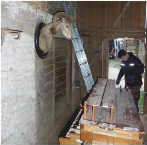
Heil unten angekommen! „Na so was“, denkt das Mufflon, das sich über so viel Betrieb nur wundern kann.