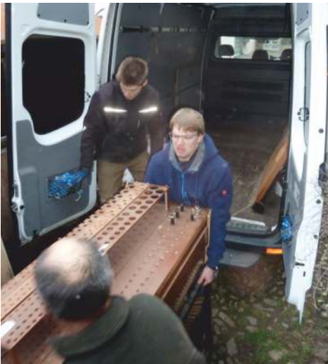
Und dann alles in den Sprinter.

Fünf Stunden hatte das gedauert. Und das alles bei 4° C. Und so lange lief auch der Warnblinker des Sprinters, weil er etwas in die Straße ragte. Als wir den Wagen für die Rückkehr starten wollten --- sprang er nicht an! Die Batterie war leer geblinkert! Also: Starterkabel aus Eichstetten holen, überbrücken (aber wo ist hier überhaupt die Batterie???) und starten.